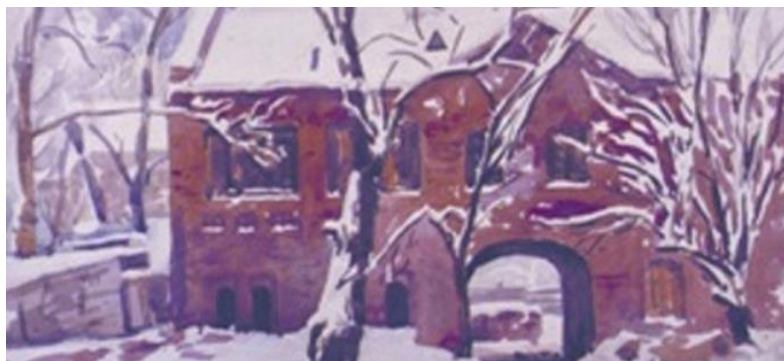
«Дом под снегом». Нач. XX. Собрание ТОХМ КП-877

Следует сказать о том, что Петр Федорович много работал в технике акварели и прекрасно владел этой техникой. Он практически ежегодно выставлял свои акварельные работы и карандашные рисунки на выставках, организуемых Томским обществом любителей художеств (1914-1919) был членом этого общества, входил в состав правления (1913).